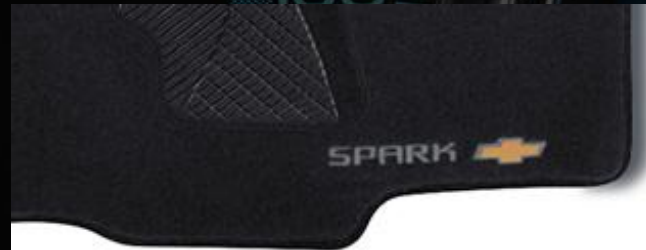
Tapetes de Alfombra