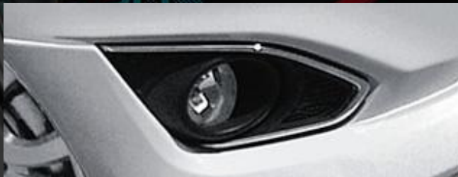
Faros de Niebla